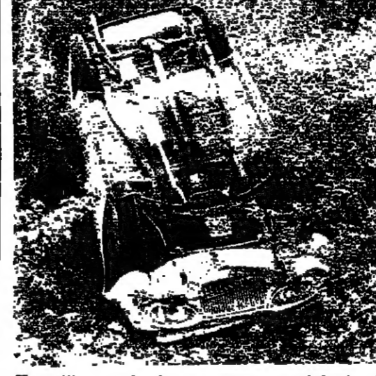
السيارة كما بنت بعد تدهورها على طريق دير القمر